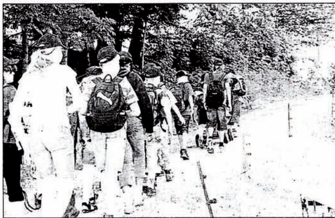
Auf Expedition: Die Teilnehmer des Biosphärencamps marschieren zur Lütterquelle nahe des Guckaisees.